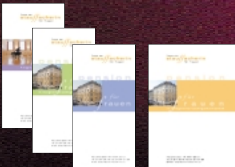
Haus zur Stauffacherin, Pension für Frauen: Corporate Design, interne und externe Publikationen

Für diese Kunden waren wir in verschiedenen Gebieten der Unter- nehmenskommunikation tätig