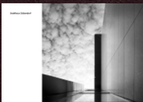
Stadthaus Dübendorf: Neubaupublikation