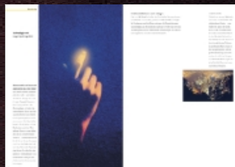
Zellweger Luwa AG: Imagebroschüre "Streiflichter"