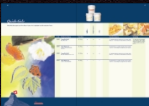
Barry Callebaut Schweiz AG: Internationale Produkte- brochure