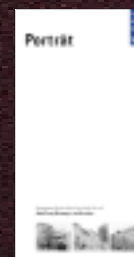
Baugewerbliche Berufsschule Zürich: Kursbroschüren und Schulporträt