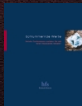
Hesta Financial Services: Imagebroschüre "Schlummernde Werte"