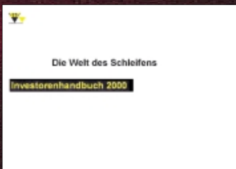
sia Abrasives Holding AG: Investorenhandbuch sia Abrasives 2000 (Konzeptarbeit und Texte)