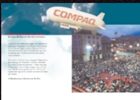
SkyBus AG: Corporate Design, Imagebrochure "70 Quadratmeter Himmel!"